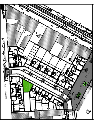
Plan de repérage

Propriété Familiale de Normandie 111, Avenue Foch 76 051 LE HAVRE Tél : 02.35.22.50.98 Fax : 02.35.41.20.82 www.pfn-coop.com